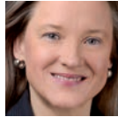
Dr. Beate Bahner

■ Bitte freimachen oder per Fax 0 69- 800 8718412 oder per eMail